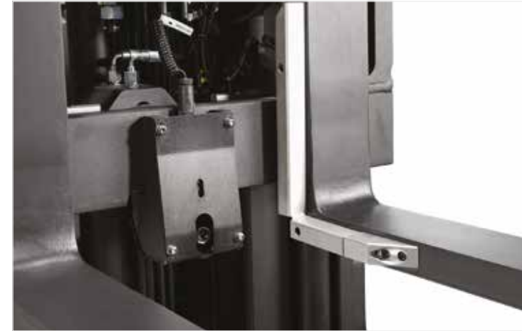
Le laser de fourches en option facilite le positionnement des fourches devant les palettes. Réduction des coûts liés aux dommages matériels et productivité élevée sont au rendez-vous