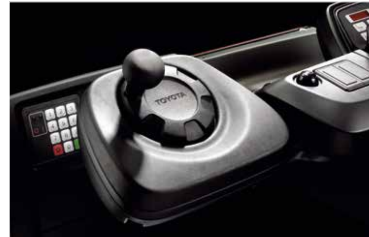
Les modèles BT Reflex série N disposent d'une direction à 360° favorisant une commande intuitive et réactive du chariot