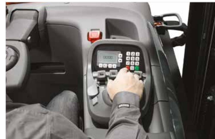
Commande du bout des doigts