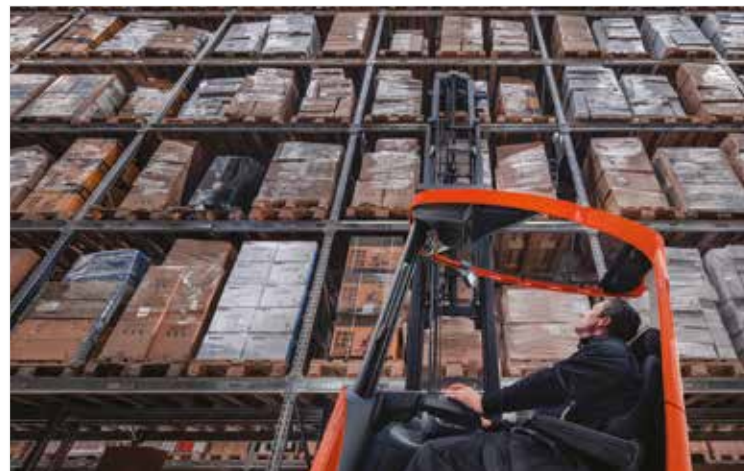
Ergonomie et sécurité renforcées avec la cabine inclinable : réduction des troubles musculo-squelettiques (par exemple tensions cervicales) du cariste et amélioration de la visibilité de la charge à grandes hauteurs