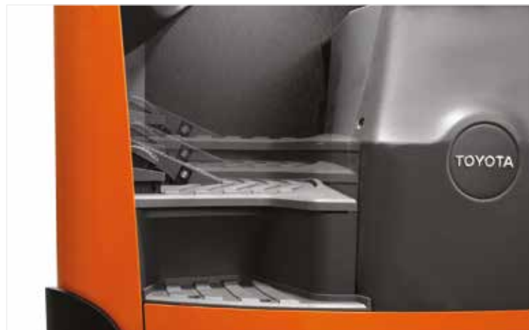
Plancher réglable en hauteur