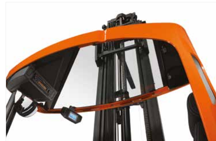
Le toit transparent offre une vue dégagée sur les fourches et facilite la manutention de charge en hauteur (option)