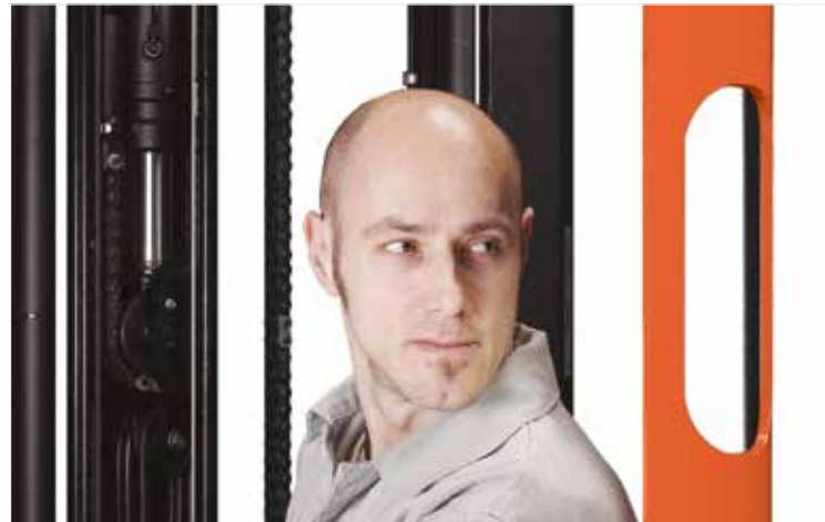
La fenêtre intégrée dans le montant arrière améliore la visibilité et la sécurité du cariste, car elle rend inutile tout mouvement hors du chariot