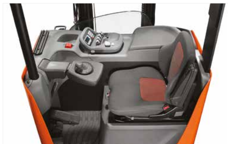
Cabine ergonomique, ici avec le siège « confort » disponible en option