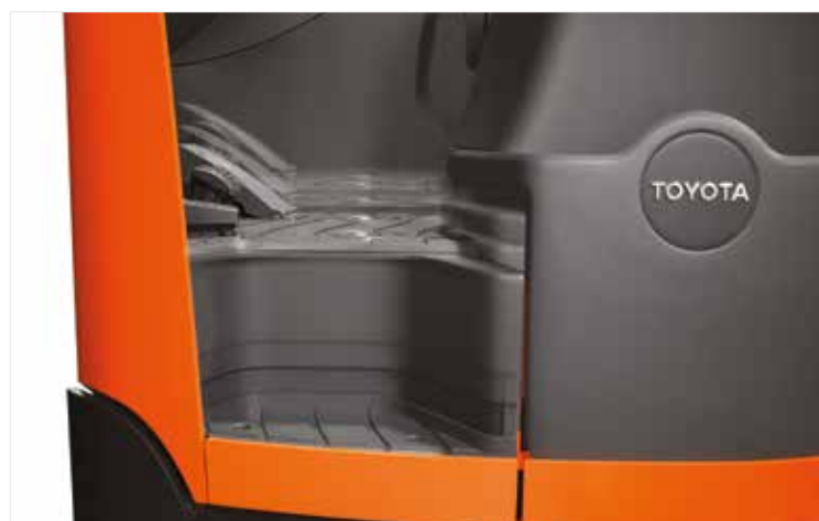
Le poste de conduite est réglable et s'adapte au cariste.. La hauteur de plancher s'adapte manuellement ou électriquement