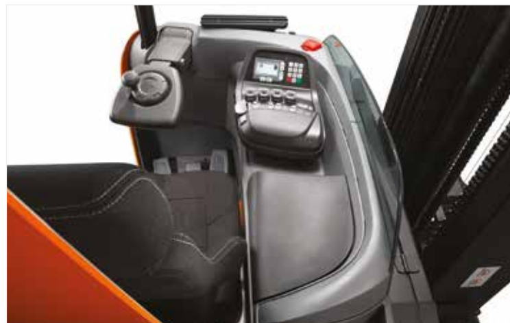
La cabine ergonomique est conçue pour s'adapter à la morphologie du cariste, lui permettant d'obtenir une productivité constante pendant son temps de travail