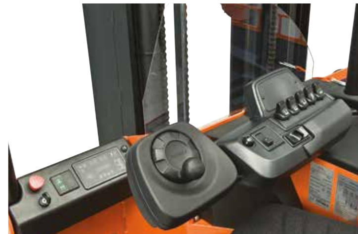
Positionné face aux fourches, le cariste bénéficie de la meilleure vision sur les charges longues de format inhabituel