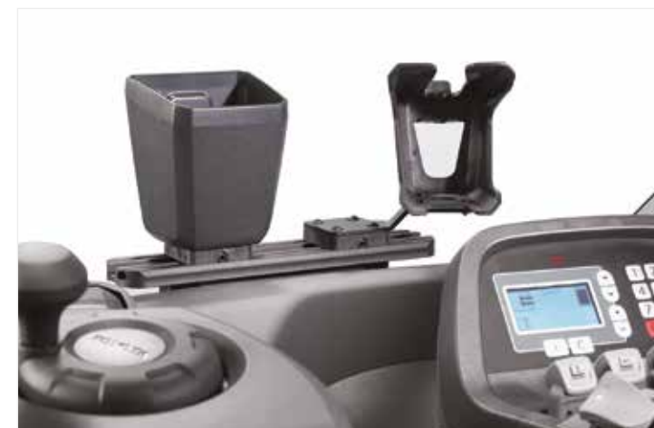
Système de fixation des équipements auxiliaires E-bar disponible en option