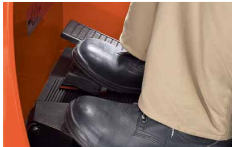
Système de freinage électronique pour un confort de conduite accru