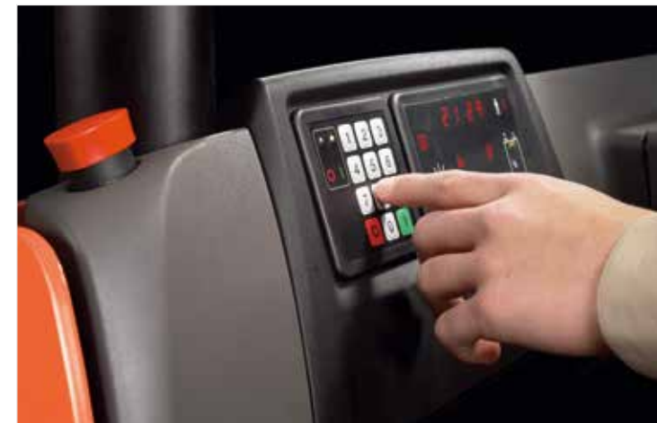
Système de contrôle d'accès BT Access Control, empêchant tout usage non autorisé du chariot