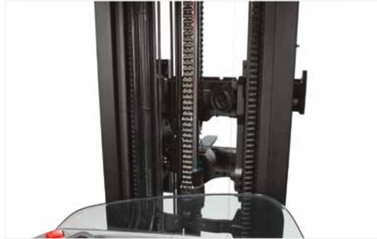
Le tablier porte-fourches à ouverture frontale avec déplacement latéral intégré offre une excellente visibilité frontale