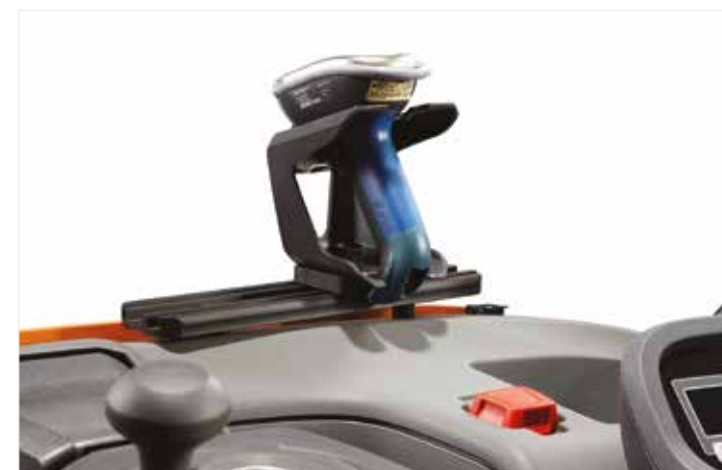
Système de fixation des équipements auxiliaires E-bar disponible en option