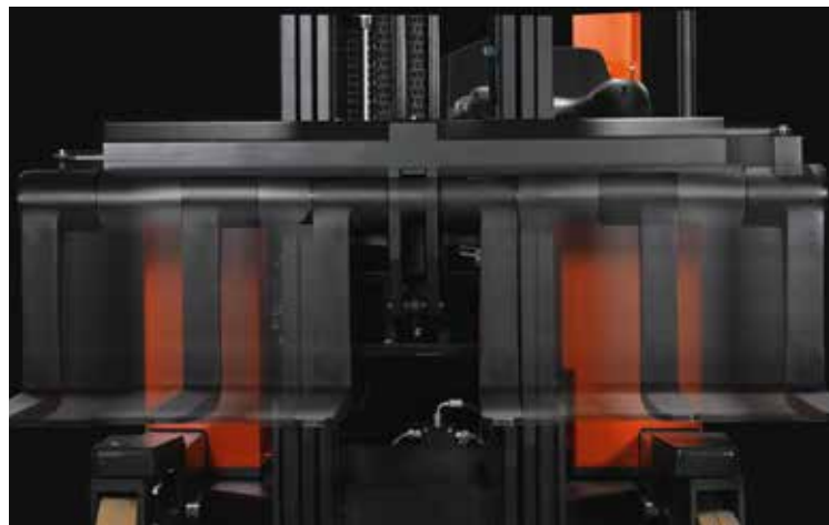
L'écarteur de fourches à commande hydraulique du BT Reflex série F permet d'adapter rapidement le chariot à des charges de dimensions variées