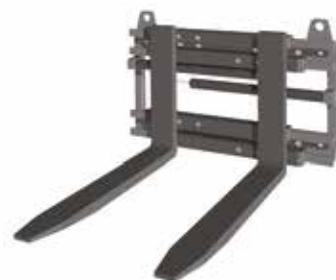
Positionneur de fourches

Attention ces accessoires nécessitent 3 ou 4 mouvements hydrauliques, donc prévoir les leviers et distributeurs montés jusqu'au tablier lors de votre commande.